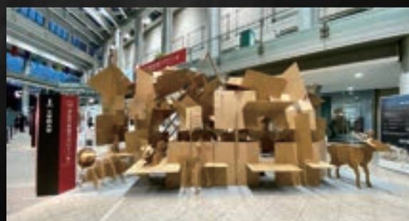
段ボールモニュメント

販売元：株式会社ポロロッカ COATMAKERS 事業部 東京都文京区本駒込 6-15-9 六義園マンション